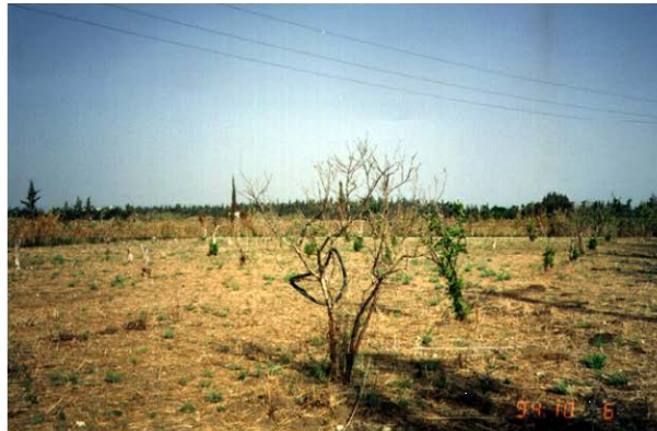
塩害により放棄された農園