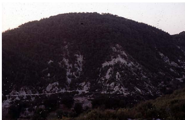
急斜面の土壌侵食