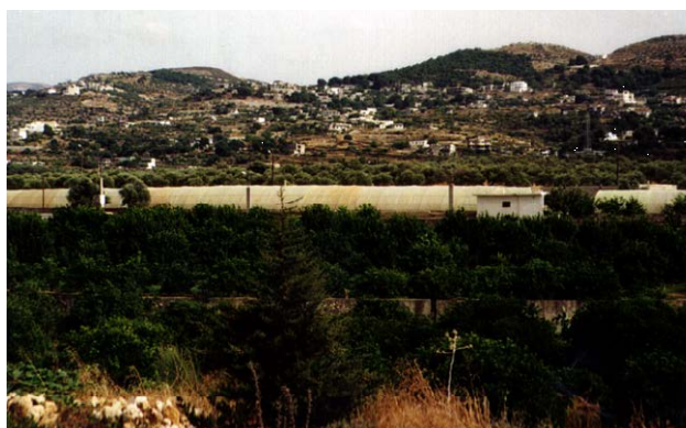
地中海沿岸地域の典型的な景観 (手前柑橘、後方オリーブ)

環境問題については、まず第一にラタキア市北部のダムサルホ地区における、海水貫入が農業上の大きな問題としてあげられる。本地域には柑橘類を中心とした果樹園が広がっていたが、近年の海岸地域におけるスポーツシティーやホテル等の開発による地下水の汲み上げが原因で、灌漑水の水質が急速に悪化しているようである。すでに栽培が放棄された農園もあり、塩害地は拡大の一途を辿っている。また、丘陵地においては、急傾斜地の土壌保全が重要な課題となっている。緩傾斜地は、ほとんどがオリーブの栽培に利用されており、伝統的な石積み技術も観察できる。しかし、作物生産に利用できない急傾斜地では植林等による土壌保全が実施されているものの、土質によってはかなり激しい崩壊も起こっているため、より効率的な対策が望まれている。