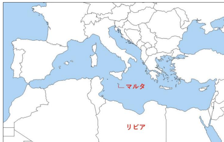
図① マルタとリビアの位置

本稿では、現在は近くて遠い両国の歴史が重なり合っていた先史から古代、リビアとマルタの運命が引き裂かれた1565年の「マルタ島包囲戦」、そしてリビアとマルタが急速に接近した1970年から80年代を中心に振り返ってみたい。